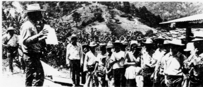
Fólk frá slíkum felögum, sum nú er í umbúna at stovna í Føroyum, luttaka í uppbyggingararbeiði í Guatemala

Sambært lógaruppskotinum, sum fyrireikingarbólkurin hevur gjørt, skal grundarlagið undir felagnum vera lokalfeløg kring í landinum.